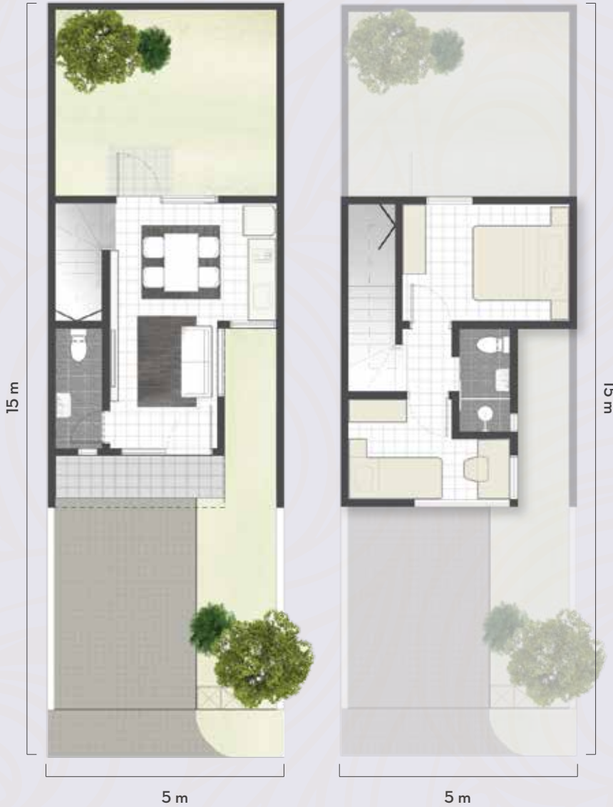
NEW DURIAN LANTAI 2