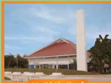
Masjid Al - A'raaf